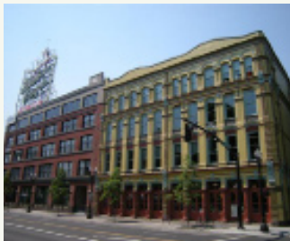
White Stag Block, Portland, Oregon, LEED-NC Gold, 2008

GBS trabaja con el propietario del edificio, el equipo de diseño y el contratista general para asegurarse de que los miembros del equipo comprendan su función específica y lo que deben dar de sí para lograr créditos específicos de LEED. Mediante la utilización de las herramientas y procesos desarrollados por nuestra amplia experiencia, distribuimos información sobre los requisitos de documentación LEED, aclaramos toda duda que surja relacionada con los criterios de créditos LEED y, en última instancia, orientamos al equipo a través de un esfuerzo LEED claro y eficiente. El equipo GBS está comprometido con el éxito de nuestros clientes y disfruta de una importante colaboración con ellos en el mejoramiento del rendimiento de sus edificios.